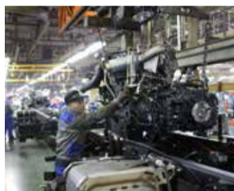
Установка двигателя на раму теперь минутное дело

Полтора месяца назад во время обсуждения реализации проекта «Повышение эффективности процессов по ГСК-1, 2» кто-то из руководителей предложил увеличить диаметр отверстия в кронштейне. Идея сразу же ушла на обсуждение к конструкторам и технологом. — Сначала вместе со специ-