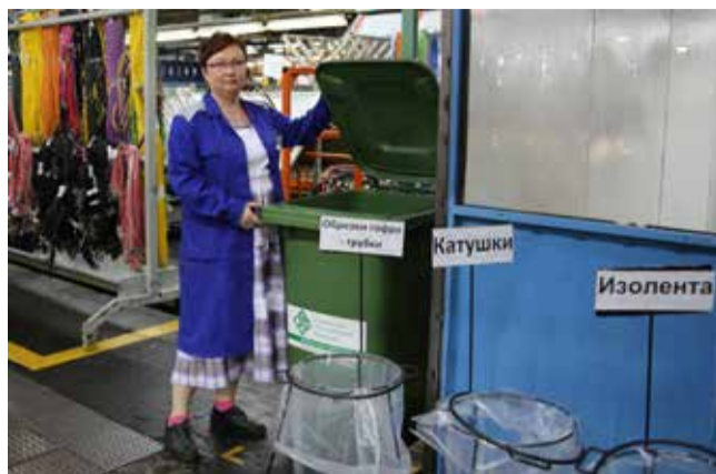
При селективном сборе отходов ущерб природе сводится к минимуму. И даже есть возможность получить прибыль

«КАМАЗу» очень важно было не только все эти годы сохранять имидж социально ориентированного, экологичного предприятия, но и обучать, воспитывать коллектив. Ведь с рождения автогиганта в его цехах трудилась многонациональная семья. Люди, приехавшие на «КАМАЗ», росли в разных условиях. Важно было донести главное — работать так, чтобы в первую очередь не навредить себе, следить за порядком в общем доме. Эти знания и навыки передаются из поколения в по-