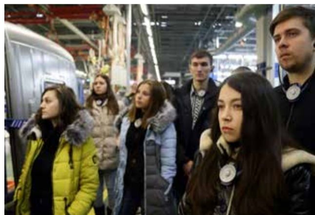
Среди молодёжи студенты 4-5 курсов различных факультетов КНИТУ-КАИ