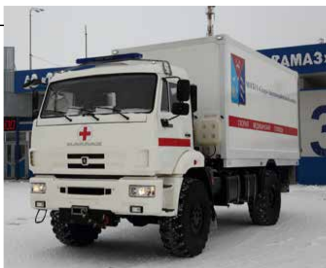
В Магаданской области теперь будет вездеходная «скорая помощь»

В этом году надежда на оказание оперативной скорой помощи появится у жителей Эвенкийского района Магаданской области. На «КАМАЗе» был собран уникальный автомобиль на базе шасси 43502 с вахтовой над-