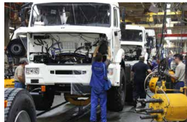
Штрафы за нарушение экологического законодательства «КАМАЗу» не грозят

Ежегодно на «КАМАЗе» утверждаются цели в области экологии. В прошлом году коллектив обязался снизить по сравнению с прошлым годом объём выбросов в атмосферный воздух на пять тонн, а сброс загрязняющих веществ в состав сточных вод на 3%, исключить загрязнение почвы нефтепродуктами на площадках базисного склада и сбора отходов литейного завода. Все они были выполнены.