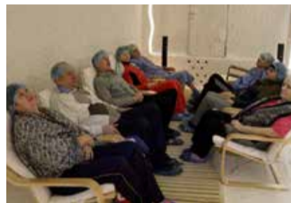
Вдыхаем лечебную соль

уникальный климат, приближенный к условиям соляных пещер. Благодаря специальному аппарату в воздухе распыляется мелкодисперсная соль, которая, проникая в самые глубокие отделы дыхательных путей, оказывает благотворное действие на восстановление функции бронхов и внешнего дыхания. Для профилактики вирусных инфекций, хронических заболеваний дыхательных путей советуем дышать соляными парами два раза в год, весной и осенью, по 10 дней. Процедуру можно принимать без специальной подготовки и возрастных ограничений».