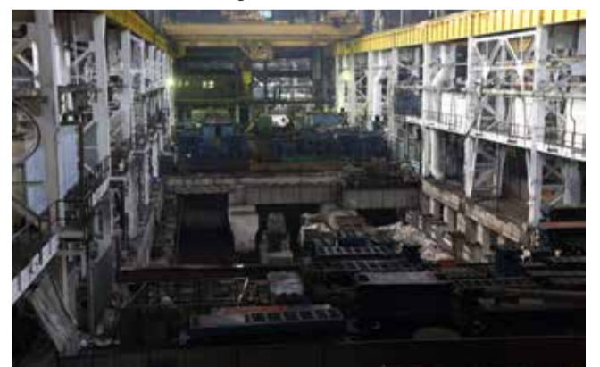
Здесь появится прессовый участок для нового производства