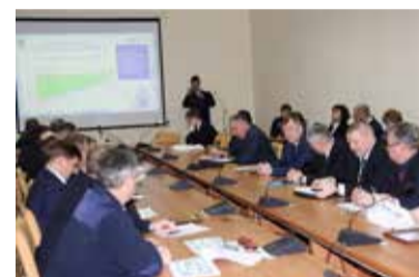
Внимание на экран! Презентации по направлениям SQDCM наглядно демонстрировали: любая проблема — основа для улучшений

Деловая встреча завершилась просмотром фильма, в котором