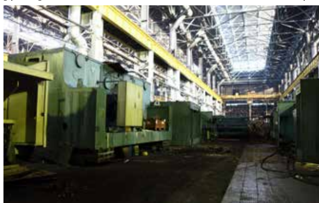
На этом месте будет размещён участок разбора и ремонта штампов

Всё оборудование должно быть готово к работе в середине 2018 года. На испытание новых штампов отводится всего шесть месяцев, затем «ДК РУС» должно дать положительное заключение по качеству. В 2019-м ПРЗ уже начнёт поставлять детали и узлы на новый завод для нового автомобиля.