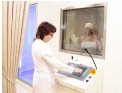
Повышаем иммунитет холодом

«В повседневной жизни мы тщательно прячемся от холода и сквозняков, зимой кутаемся в тёплые шубы. А между тем холод способен оказывать чудодейственный эффект на наш организм и даже повышать иммунитет. В клинике-санатории существует метод лечения холодом — криотерапия. Температурный режим в криосауне начинается с -60 °С и постепенно снижается до -110 °С. Благодаря процедуре регулируется мышечный тонус, налаживаются двигательные функции, улучшается кровообращение и общее состояние организма».