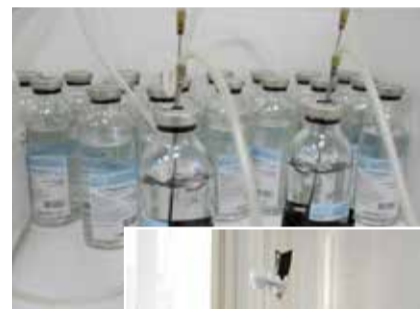
Вливаем озонированный физраствор

рованного физиологического раствора. Озонный способ воздействия приводит иммунитет к балансу, снимает синдром хронической усталости, способствует выработке гормона радости. Он практикуется как в целях профилактики заболеваний, так и лечения, в три-четыре раза сокращая длительность болезни. Продолжительность курса — 5-10 капельниц».