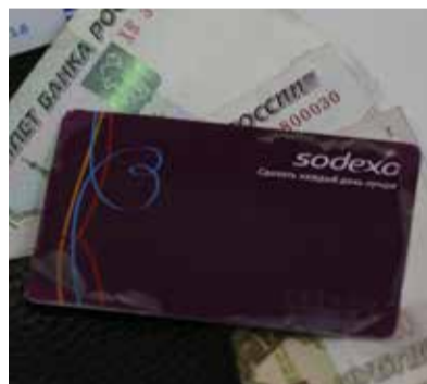
На замену старой карте скоро придёт новая

Новинкой можно будет пользоваться не только в общественном транспорте нашего города, но и за его пределами: в Казани, Альметьевске, Зеленодольске, Нижнекамске. За деньги на карте питания переживать не стоит. Их там попросту нет. Как известно, камазовцы питаются в долг с последующим списанием средств из зарплаты. В плане питания ничего