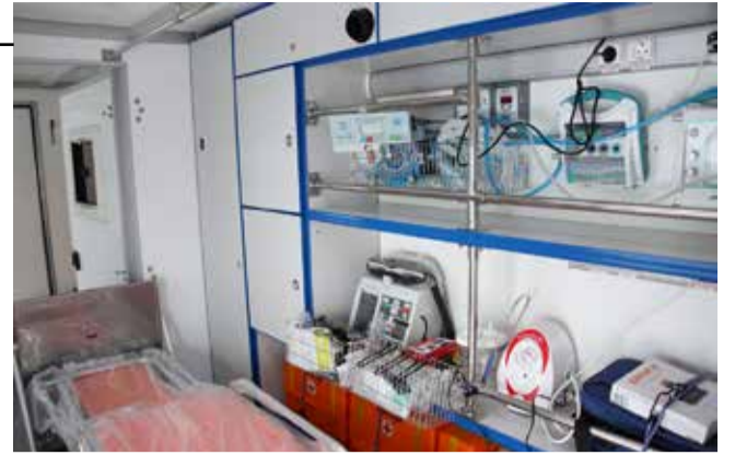
В медицинском КАМАЗе есть всё необходимое для оказания помощи по пути следования

Водитель новой машиной доволен — ход у КАМАЗа, оснащённого задней пневматической подвеской, очень плавный. Дорогу вездеход