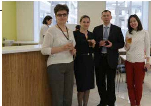
Сотрудники генеральной дирекции могут порадоваться себя фиточаем. Пока в ассортименте — витаминный, желудочный и успокаивающий

продлятся недолго. Уже в феврале будет доставлено необходимое оборудование для зоны раздачи, где сотрудники дирекции смогут увидеть все преимущества фри-фло — свободного движения, нового формата общепита.