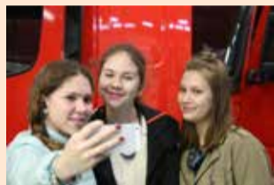
Какой турист без селфи?

Конкурс, ранее проходивший под названием «Туризм — XXI век», традиционно собирает большое число участников. Это предприятия туристической индустрии РТ: музеи и музеи-заповедники, учебные заведения в сфере туризма, муниципальные образования, организации инфраструктуры туризма (отели и гостиницы, развлекательные комплексы, предприятия питания, сувенирные компании).