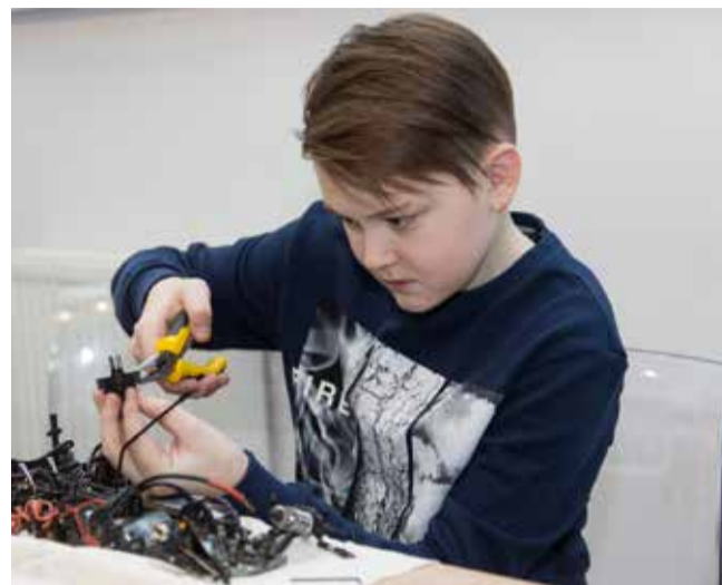
Создание в автокванте совершенно новых автомобилей со всеми системами управления — занятие очень увлекательное