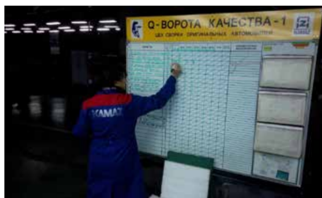
На конвейере — информация из первых рук

— Я уже говорил, что прежние лучшие наработки взяты на вооружение — ворота, петли качества, особенно №№1 и 2, напомним и о 701-м распоряжении заместителя гендиректора по персоналу: тот, кто обнаружил брак и не позволил ему попасть во внешний мир, получает премию. К ним добавляются другие. Например, увеличивается доля качества в заработной плате сотрудников. На конвейере формируются мини-бригады — к этой идее мы вернулись, скажем так, на новом витке. Все цели ясны, «дорожные карты» прописаны, а показатели измеримы. Конкуренция становится всё жёстче. Ответ на этот вызов — жёстче к себе должен относиться каждый из нас.