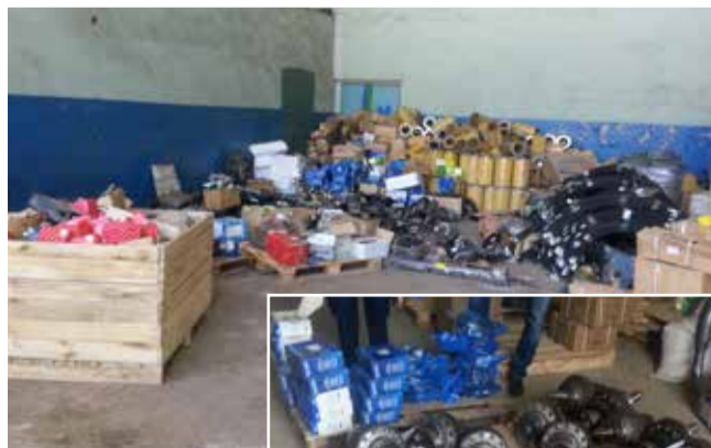
Изъятая контрафактная продукция — вещественное доказательство

За год проведено 57 рейдов в 117 торговых точках, из них 21 — с правоохранительными органами. Сделано 13 негласных закупок, из них 4 — также с участием правоохранительных органов.