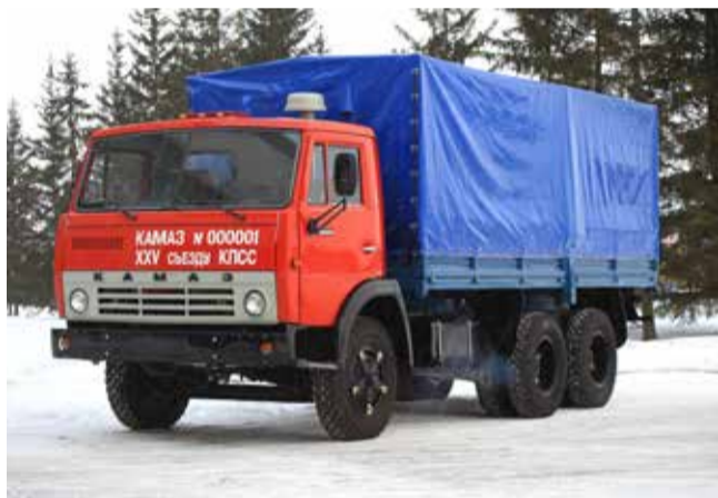
393309 бортовых тягачей этой модели исправно служили стране

С 1979 по 1983 год с конвейера ежегодно сходило более 29 тысяч машин этой модели.