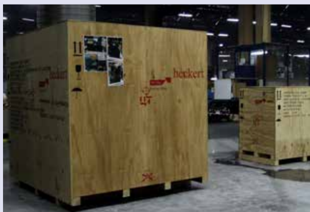
На заводе двигателей идёт приёмка оборудования с целью дальнейшего монтажа под производство нового двигателя рядной «шестёрки».