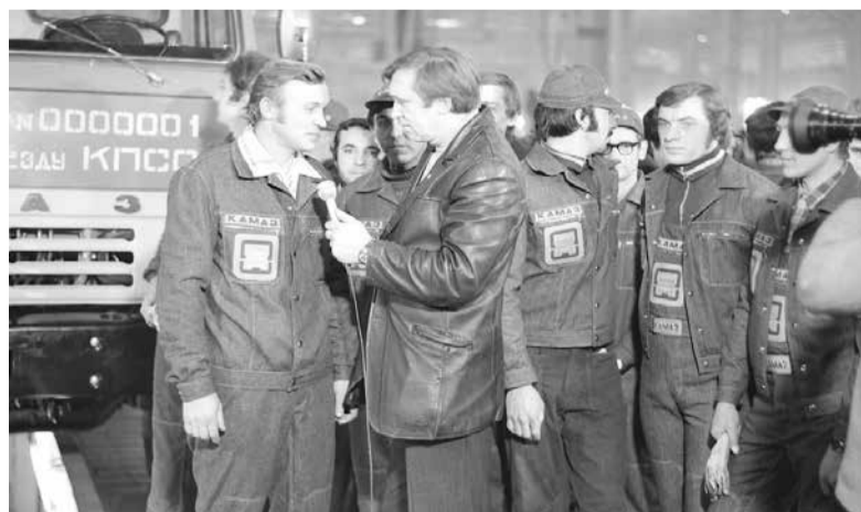
Каждый участник первой сборки автомобилей получил комплект рабочей формы из синей джинсовой ткани: комбинезон, куртку и кепку. 16 февраля 1976 года сборщики были в центре внимания! Они неустанно давали интервью прессе, находясь под прицелом фото- и телекамер