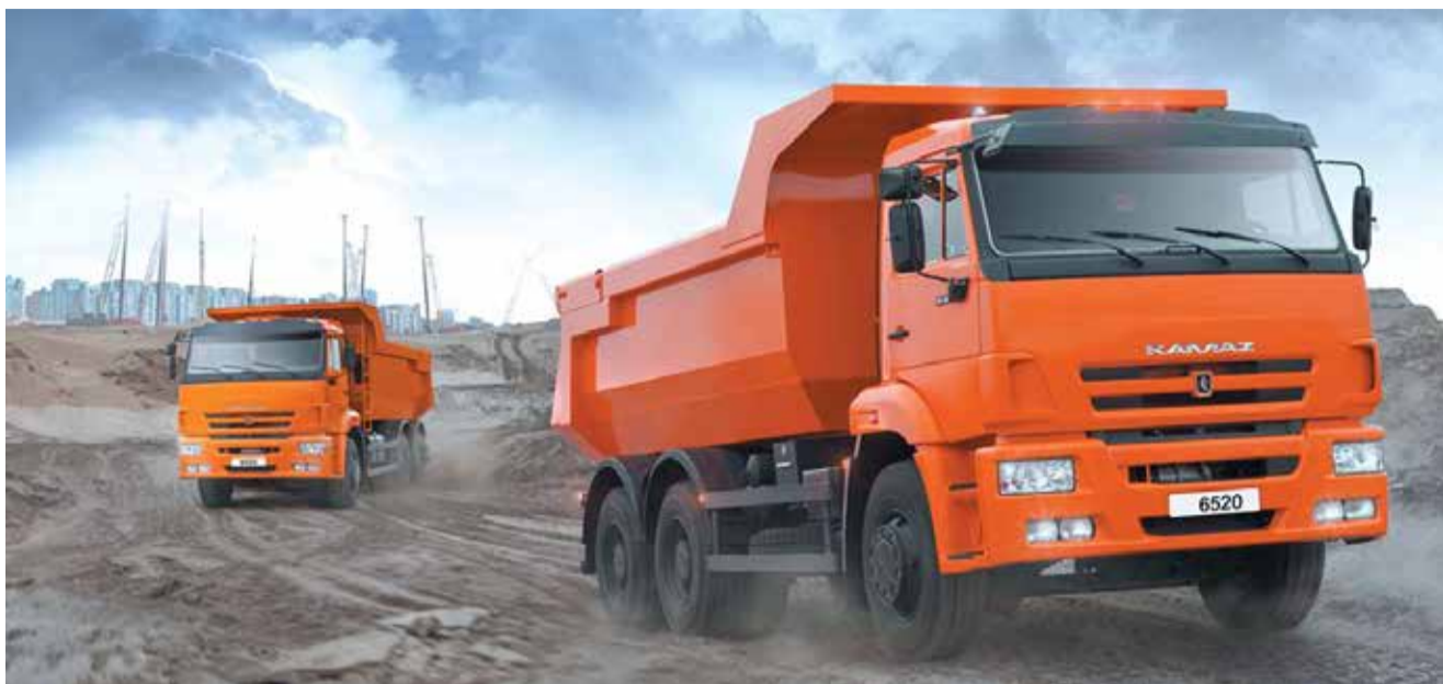
Больше половины КАМАЗов-6520 выпущено за последние пять лет

Производство значительно сократилось в 1994 году, а в 2000-м была выпущена последняя машина.