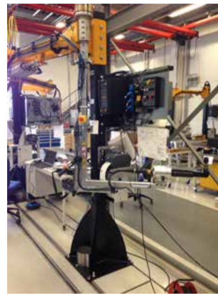
Так будет выглядеть рабочее место слесаря МСР на подборке ГУРа в 2019 году

Есть и более прозаические задачи, над которыми работает сейчас инженерный и технологический штаб АвЗ. Надо повысить проходимость конвейера, пока длинномерные шасси застревают на участке после кантователя. Придётся приподнять защитную сетку, закрыва-