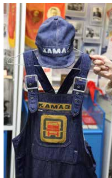
Один из комплектов одежды по сей день хранится в музее «КАМАЗа». На ощупь ткань прочная и мягкая, а это значит, что в костюме было удобно работать