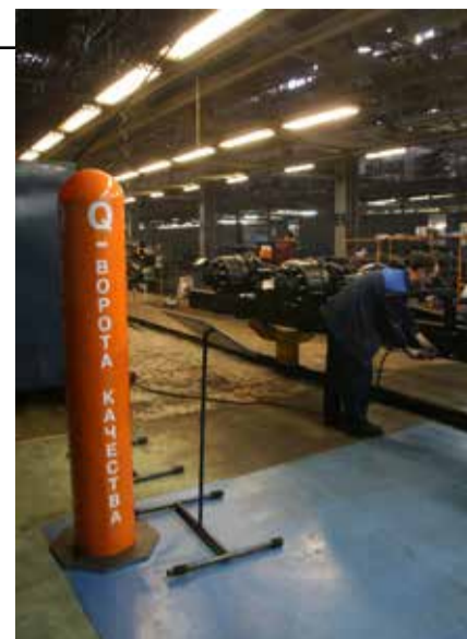
Качество в целом зависит от качества в деталях. Приоритет №1: защита клиента от продукции с дефектами, покидающей завод

— Общая картина — да, причём мы все находимся в этой системе, все заводы вовлечены в процесс. В модуле «Качество в целом», в свою очередь, определили семь приоритетных направлений и лидеров рабочих групп. К финишу близится работа над Стратегией качества, меняется организационная структура нашей службы. В частности, создан новый отдел, который занимается анализом рекламационных дефектов. Новая «единица» — инженер по качеству поставщиков — вводится в структуру закупок. Эти специалисты призваны стать на заводах «оперативниками», мгновенно реагировать на сигналы и быть связующим звеном между заводом, блоком развития, центром закупок и поставщиками. Очень важна вовлечённость камазовцев в этот проект, и здесь во многом смыкаются задачи качества и