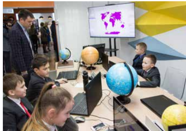
В геоквантуме учат картографии и проектированию виртуальных карт местности