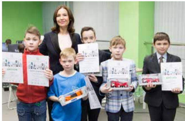
Эти ребята уже умеют создавать автоматизированные комплексы по обслуживанию автомобилей, а их роботы успешно побеждают на международных и российских соревнованиях