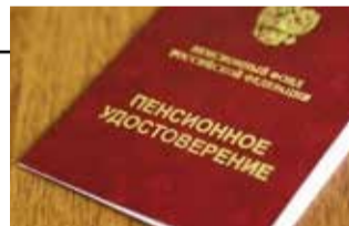
Получили удостоверение — становитесь на учёт

Среди камазовцев ходит и такая история. Один молодой человек для своей возлюбленной арендовал на 14 февраля каток «Медведь». Была романтическая музыка, стол в центре, фужеры. Там же прозвучало предложение. Девушка согласилась.