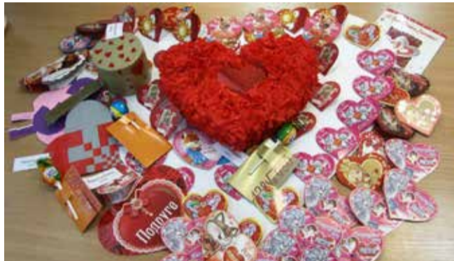
На этом коллаже из признаний дизелистов Любино сердце самое красивое

Я приготовила свой сюрприз — объёмное алое сердце из бумаги. Над подарком трудилась четыре дня. Признание выглядело внушительно и оригинально. Вручать валентинки пошли парой — я в костюме Коварной Любви и Купидон со стрелами. В глазах человека, которому было предназначено моё послание, было смущение и замешательство. Ответа я пока не получила. Быть может, его мой костюм смутил?