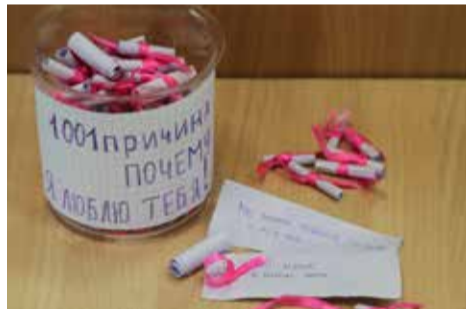
Здесь 1001 записочка. У кого больше?