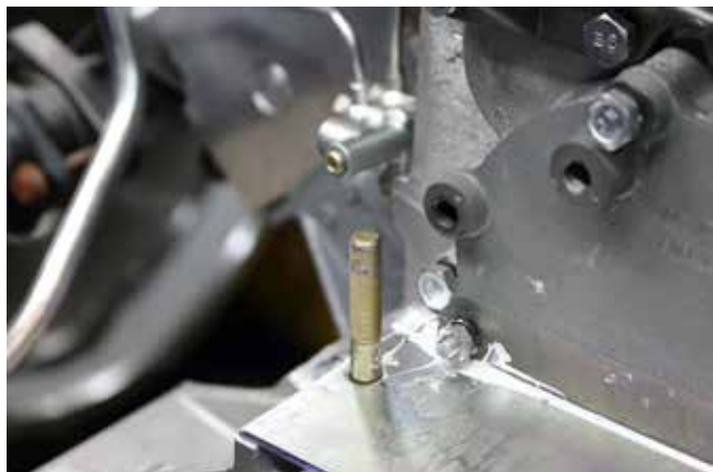
Маленькая направляющая шпилька помогла в решении больших проблем