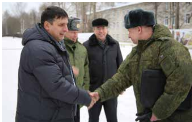
У камазовских кадровых служб с воинскими частями крепкие отношения

По сведениям кадровых служб, в родной коллектив возвращаются от 30 до 90% призванных в армию. Охотнее всего идут на предприятия, с сотрудниками которых связь не прерывалась и во время службы. Например, в «Челныводоканале» есть традиция поздравлять солдат с Днём защитника Отечества открытками от руководителя предприятия и молодёжной организации. Так что пишите письма!