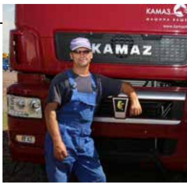
Трёхосник — товарищ надёжный