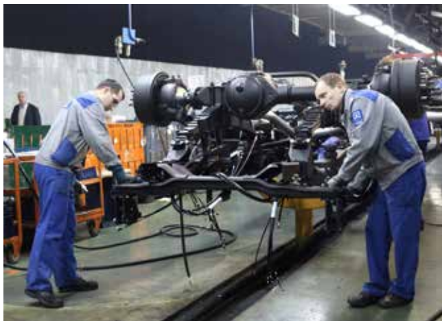
Рабочие поддерживают нововведения