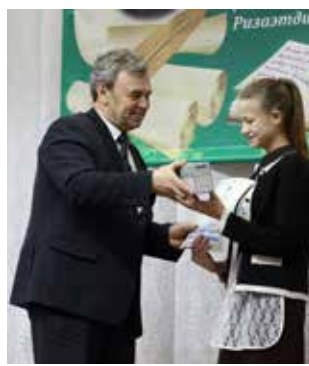
Первые призы за победу в камазовском конкурсе