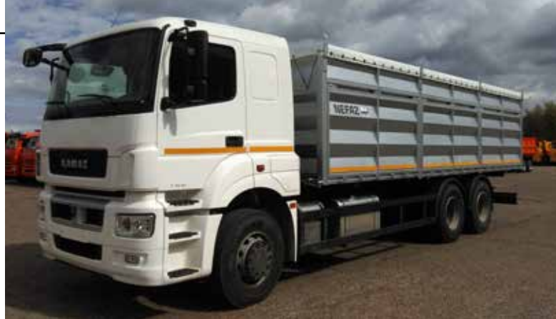
Зерновоз на базе шасси КАМАЗ-65207 — достойный представитель нового модельного ряда

Для этих целей подходит и используется практически весь автомо-