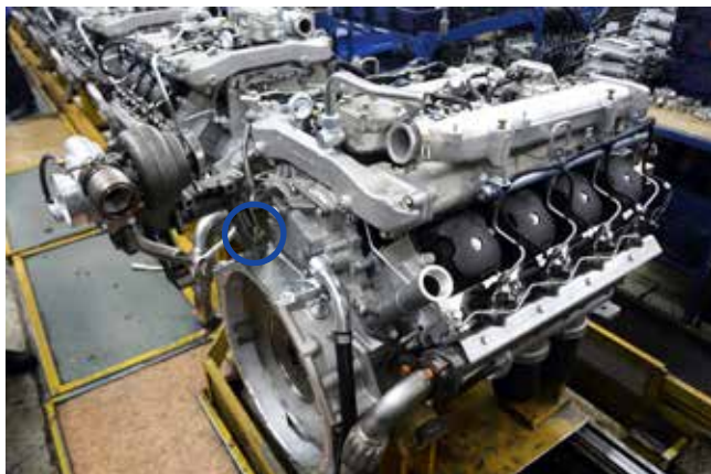
Турбокомпрессор, зафиксированный на шпильке (шпилька обведена кругом)