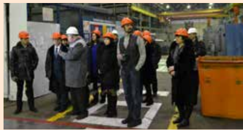
Экскурсия по производству

По итогам работы было подписано соглашение о сотрудничестве между ПАО «ТЗА», сектором по молодёжной политике, Центром занятости населения, управлением образования и учебными заведениями. Результатом взаимодействия должны стать мероприятия, направленные на повышение престижа рабочих профессий.