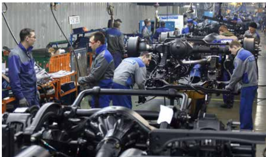
Бригады — мини, эффект — максим