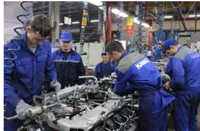
Главный сборочный конвейер двигателей движется с тактом в 86 секунд