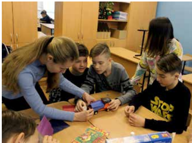
Создание своей машины — дело очень увлекательное!

Дух познания проник даже в спортзал, там ребята вместе с заводчанами проверяли на прочность «по поручению команды «КАМАЗ-мастер» новую подушку безопасности». Правда, эта разработка очень напоминала фитнес-мячи, а само тестирование — со-