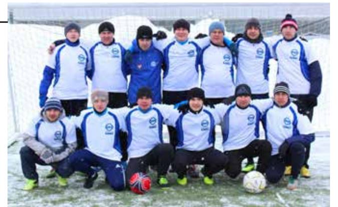
В 2016 году команда «Профсоюз «КАМАЗа» показала неплохие результаты