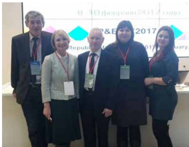
Камазовская делегация форума