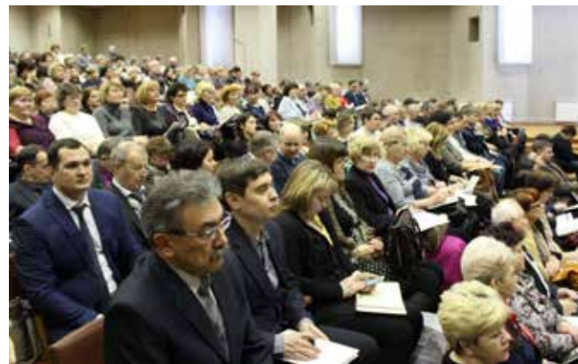
В семинаре-совещании приняли участие более 200 профсоюзных активистов из различных предприятий и организаций. Самой многочисленной стала камазовская делегация из 120 профработников

здать вопросы. А завершилось мероприятие церемонией награждения. За добровольный труд и большой вклад в развитие социального партнёрства благодарностью мэра города, благодарностью руководителя исполкома г. Набережные Челны, а также Почётной грамотой ФП