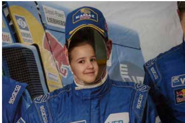
Я — пилот