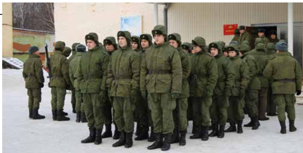
Привычка к дисциплине в жизни пригодится