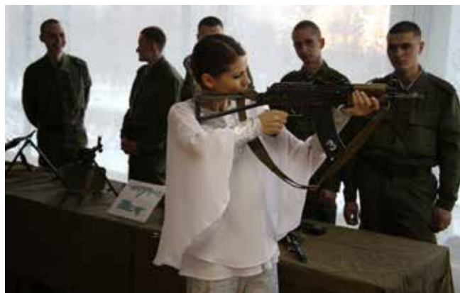
Приезжающим по праздникам девушкам-артисткам бойцы скупать не дают