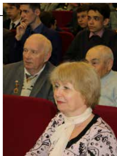
За камазовскими двигателями стоит труд этих людей