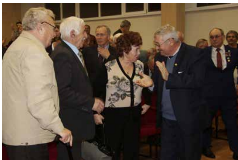
В этот день все искренне радовались встрече друг с другом

«Митинг, посвящённый сборке первого силового агрегата, состоялся 41 год назад в 12 часов дня.