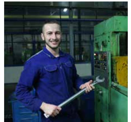
«Железо — моя стихия»