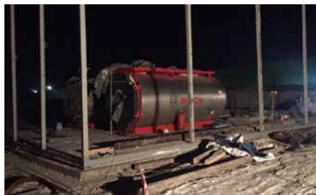
Водогрейные котлы будут подключены уже в январе

Старт самому крупному проекту в энергетике «КАМАЗа» за последние годы дан приказом генерального директора об открытии инвестиционного проекта