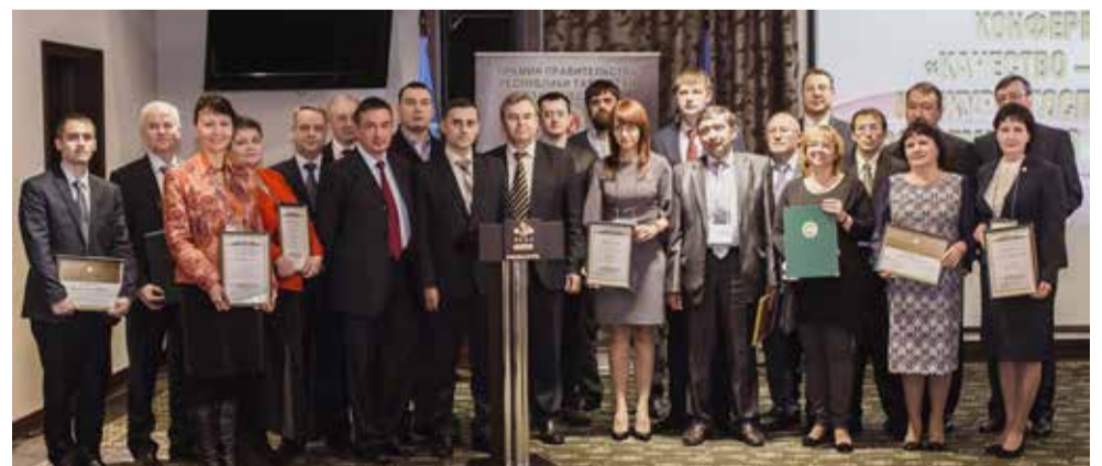
Самые приятные минуты конференции