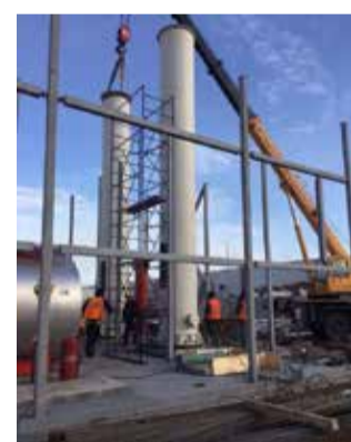
Установлены первые секции дымовых труб

Под здание котельной залит фундамент, смонтированы металлоконструкции модуля, установлены первые секции дымовых труб котлов и трубы теплоснабжения