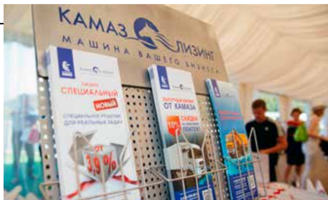
ГК «КАМАЗ-ЛИЗИНГ» постоянно работает над улучшением продукта

лизинговых сделок за девять месяцев 2016 года выросло на 65%. И, кстати, по последнему рейтингу RAEX (Эксперт РА) Лизинговая компания «КАМАЗ» занимает 14-е место среди крупнейших лизинговых компаний, которые работают во всех сегментах рынка лизинга: в авиационном, железнодорожном и в других. Мы же реализуем только автотехнику производства ПАО «КАМАЗ» и его