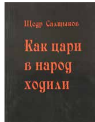
Познакомиться с романом можно на сайте Литрес.ру