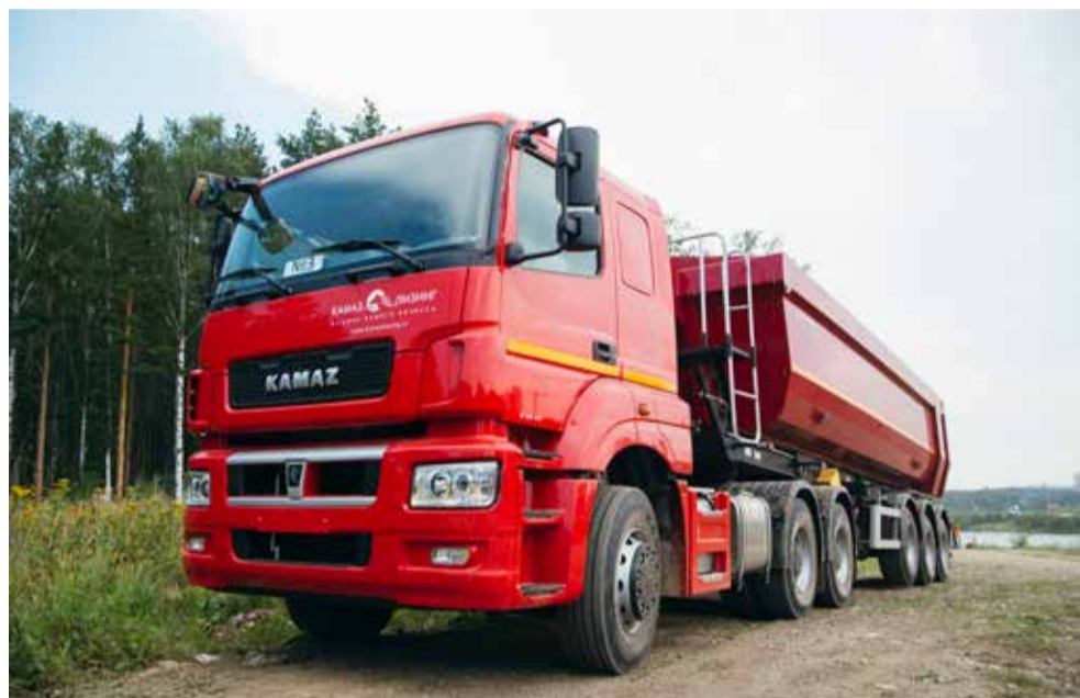
Новые высокопроизводительные большегрузы будут приносить прибыль

Итоги работы в 2015 году были рекордными по объёмам роста лизингового портфеля — он увеличился более чем в 1,5 раза. В текущем году мы постарались его сохранить. А вот число