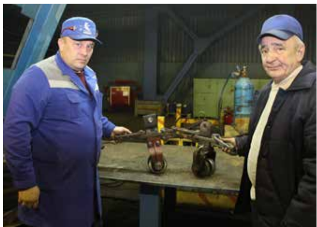
Специалисты ремонтной службы заменили 989 кареток, не остановив конвейер ни на минуту