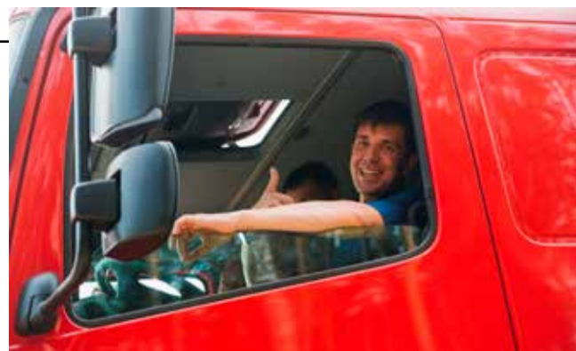
Машина что надо!

— В текущем году особенно востребован наш новый тягач КАМАЗ-5490. Доля продаж этой модели по итогам 11 месяцев составила 34%. Также большим спросом пользуется самосвал КАМАЗ-6520, его доля в продажах 23%.